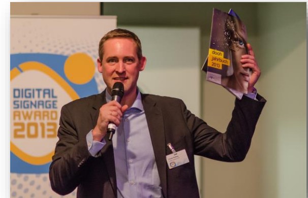
Präsentation des Jahrbuches auf dem invidis Yearbook Release Event