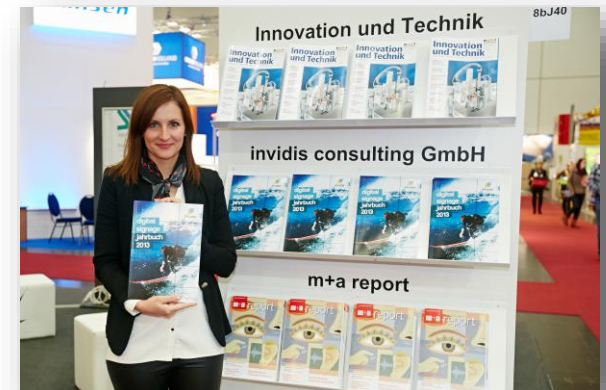
Auslage des Jahrbuches auf der Viscom 2013