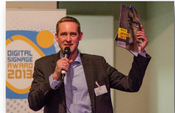
Präsentation des Jahrbuches auf dem invidis Yearbook Release Event